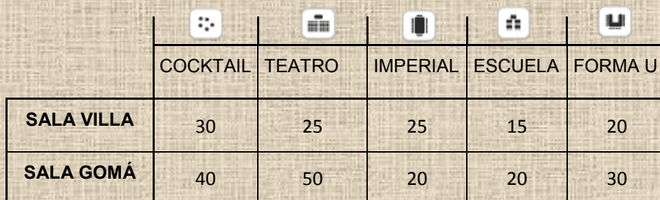
TABLA DE CAPACIDADES

Te invitamos a descubrir todo lo que podemos hacer por ti.